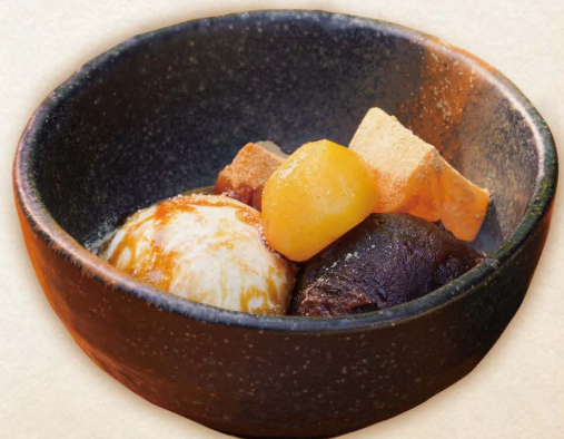
▼ 黒蜜きなこアイス