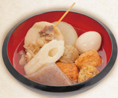
▼ おでん五種 盛り合わせ