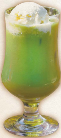
◀ 京都宇治抹茶 辻利 抹茶ミルクフロート