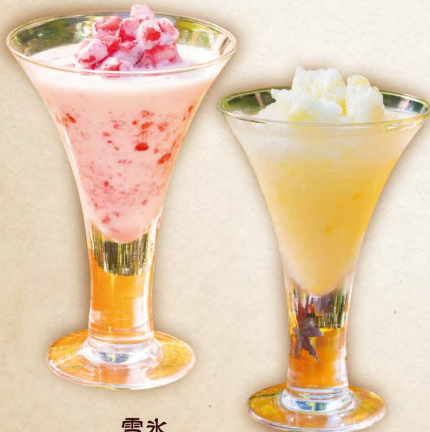
雪氷 炭酸シチリアレモン ▲