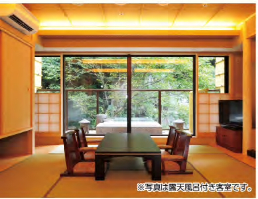
※写真は露天風呂付き客室です。